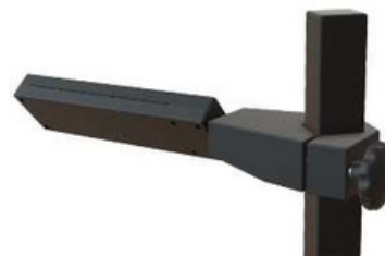
Visor de alinhamento de fio com sistema de calibração.